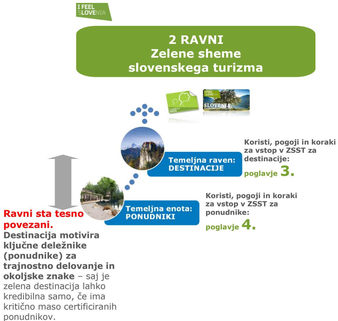
Shema št. 1: Prikaz dveh ravni delovanja ZSST